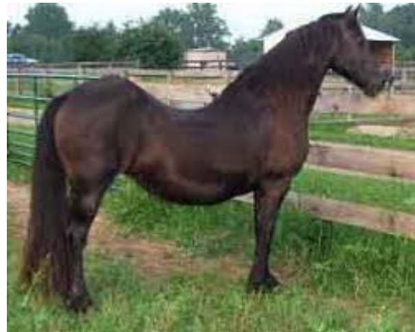
Via doorgezakte merrie